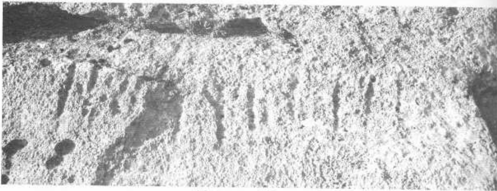
Цахирын I бичээс